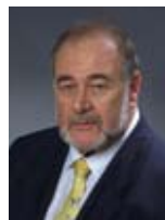
אברהם הירשזון שר האוצר