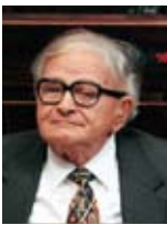
רפי איתן השר לענייני גימלאים