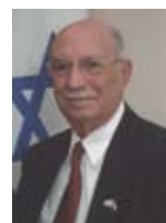
יעקב בן יזרי שר הבריאות