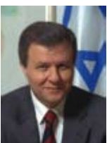
מאיר שטריט שר הבינוי והשיכון שר הפנים