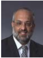
משולם נהרי שר בלי תיק