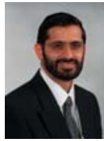
אלי ישי סגן ראש הממשלה שר התעשייה, המסחר והתעסוקה