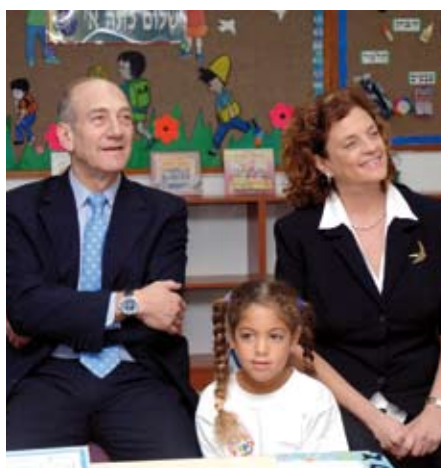
ראש הממשלה אהוד אולמרט ושרת החינוך יולי תמיר בלוויית ילדי כיתה א', עם פתיחת שנת הלימודים