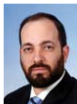
אריאל אטיאס שר התקשורת