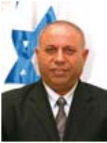
ראלב מ'אדלה שר המדע, התרבות והספורט