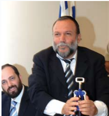
ראש הממשלה אהוד אולמרט מבקר במכון הוולקני בבית דגן, מימינו רעייתו עליזה אולמרט ושר החקלאות ופיתוח הכפר שלום שמחון