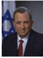
אהוד ברק סגן ראש הממשלה שר הביטחון