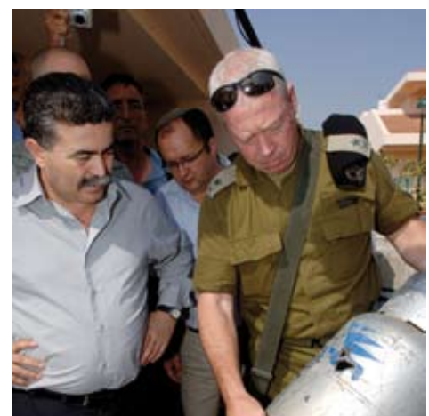
שר הביטחון עמיר פרץ ואלוף פיקוד הדרום יואב גלנט בוחנים נזק שנגרם כתוצאה מנפילת טיל סאם בשדרות

מצוינות ומובילות בקנה מידה בינלאומי בתחומי המחקר התאורטי, המדעי והיישומי.