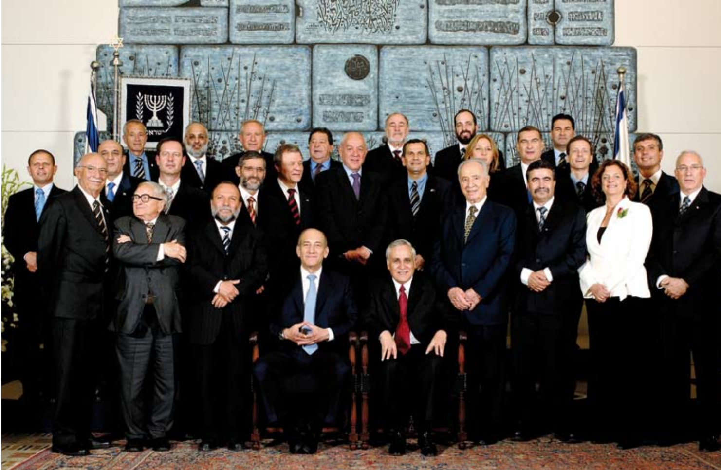
◀ הממשלה ה-31 בראשותו של אהוד אולמרט ביום כינונה בבית הנשיא משה קצב