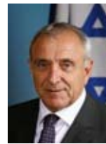
יצחק אהרנוביץ שר התירות