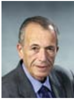
גדעון עזרא שר להגנת הסביבה