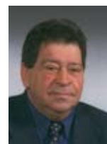
בנימין בן אליעזר שר התשתיות הלאומיות