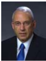
זאב בוימ שר לקליטת עלייה שר הבינוי והשיכון