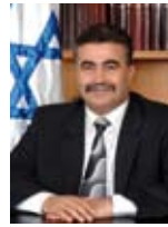
עמיר פרץ סגן ראש הממשלה שר הביטחון