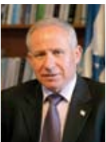
אבי דיכטר שר לביטחון פנים