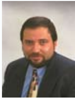
אביגדור ליברמן סגן ראש הממשלה שר לנושאים אסטרטגיים