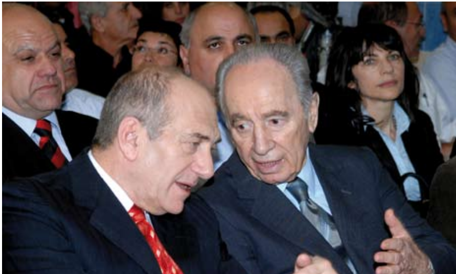
ראש הממשלה אהוד אולמרט והמשנה לראש הממשלה שמעון פרס

עם הצגת הממשלה בכנסת, ו' אייר תשס"ו (2006)