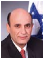
שאול מופז סגן ראש הממשלה שר התחבורה והבטיחות בדרכים