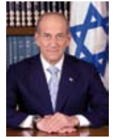
אהוד אולמרט ראש הממשלה