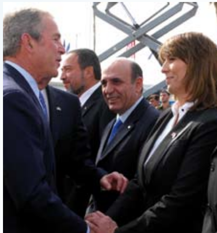
נשיא ארה"ב ג'ורג' בוש לוחץ את ידה של השרה רוחמה אברהם-כלילא עם נחיתתו בשדה התעופה בן גוריון. משמאלה השרים שאול מופז ואביגדור ליברמן