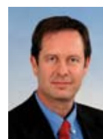
אופיר פז פינס שר המדע והטכנולוגיה