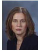
ציפי לבני ממלאת מקום ראש הממשלה, שרת החוץ שרת המשפטים