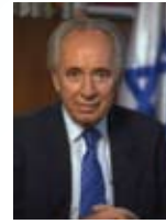
שמעון פרס המשנה לראש הממשלה, שר לפיתוח הנגב והגליל