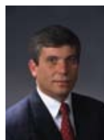
שלום שמחון שר החקלאות ופיתוח הכפר