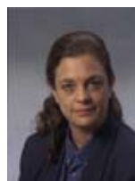
יולי תמיר שרת החינוך