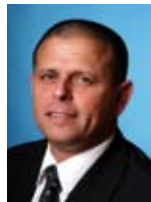
איתן כבל שר בלי תיק