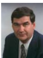
חיים רמון שר המשפטים שר המשנה לראש הממשלה