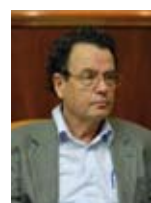
דניאל פרידמן שר המשפטים