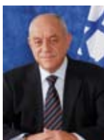
רוני בר און שר הפנים שר האוצר