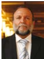
יצחק כהן שר לשירותי דת