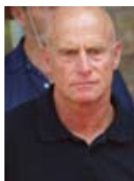
עמיחי אילון שר בלי תיק