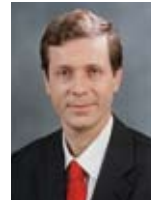
יצחק הרצוג שר התיירות, שר הרווחה והשירותים החברתיים