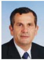
יעקב אדרי שר (מקשר בין הממשלה לכנסת), השר לקליטת עלייה, השר לפיתוח הנגב והגליל