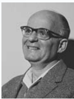
גיאורא יוספטל שר העבודה