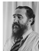
בנימין מינץ שר הדואר