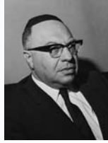
יוסף בורג שר הסעד