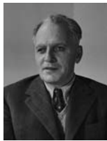
בכור שלום שטרית שר המשטרה