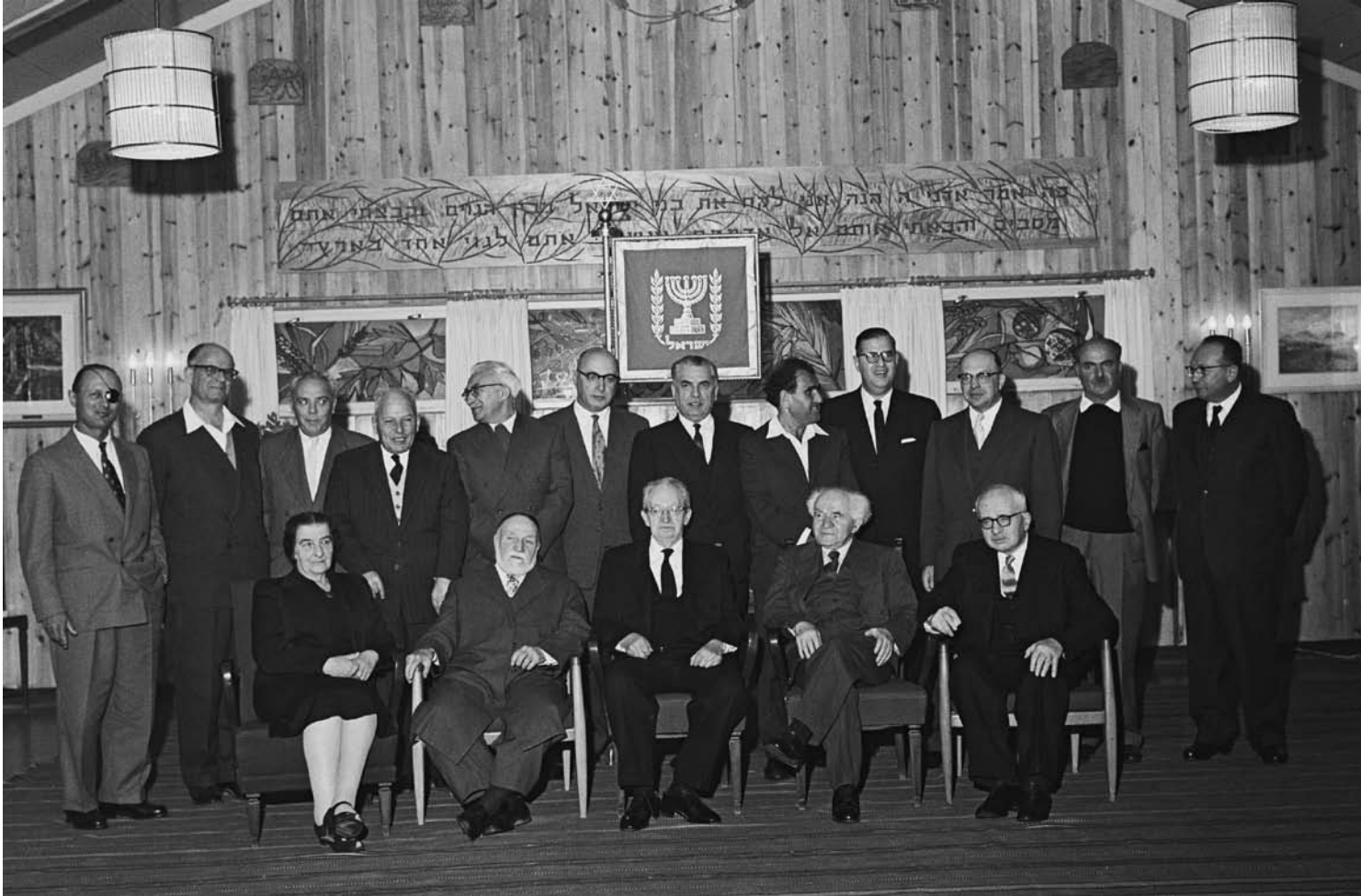
◀ הממשלה ה-9 בראשותו של דוד בן גוריון סמוך ליום כינונה בבית הנשיא יצחק בן צבי

ט"ז כסלו תש"כ 17.12.1959 - כ"ג חשוון תשכ"ב 2.11.1961