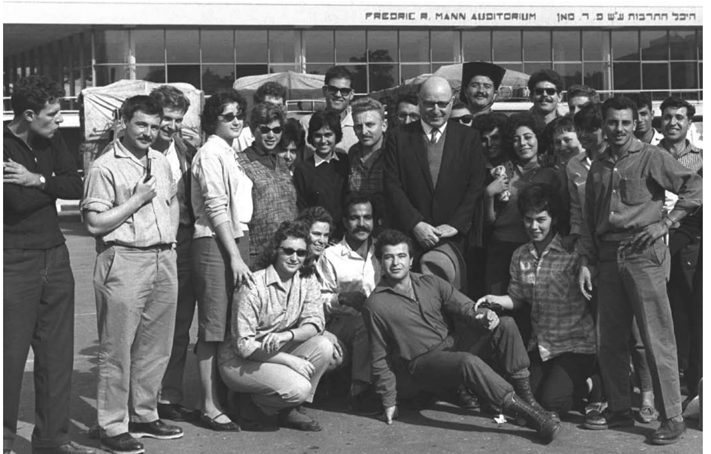
שר המסחר והתעשייה פנחס ספיר בצילום משותף עם אזרחים בתל אביב