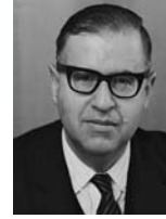
אבא אבן שר בלי תיק שר החינוך והתרבות