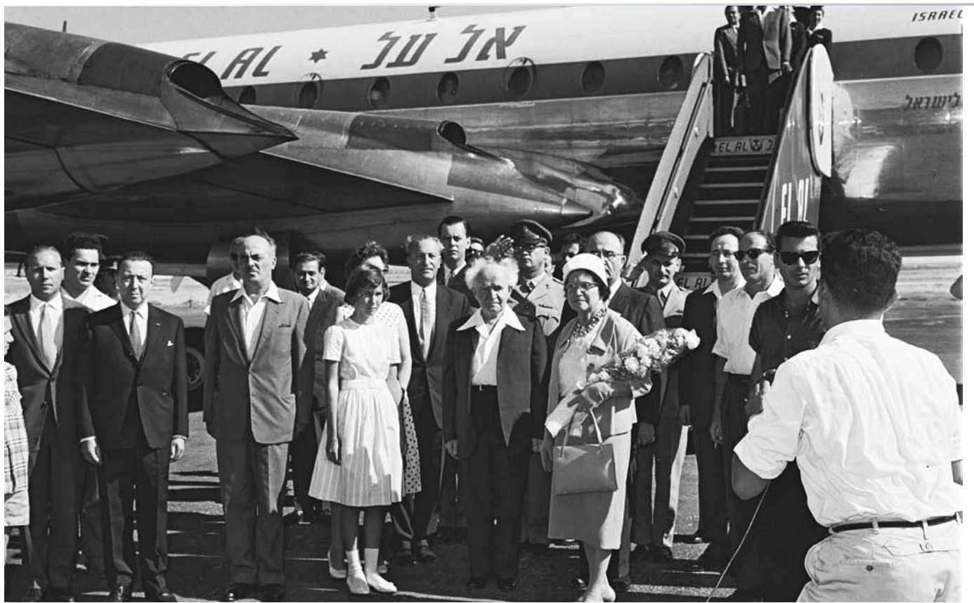
ראש הממשלה דוד בן גוריון, רעייתו פולה ושרי הממשלה בשדה התעופה לוד עם שובו מביקור באירופה