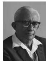
מרדכי בנטוב שר הפיתוח