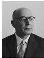
פנחס ספיר שר המסחר והתעשייה