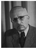
פנחס רוזן שר המשפטים