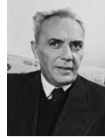
זלמן ארן שר החינוך והתרבות