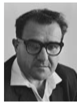
ישראל ברזילי שר הבריאות