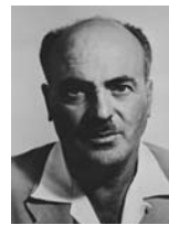
יצחק בן אהרון שר התחבורה