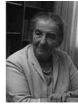
גולדה מאיר שרת החוץ

בערכות יעילה של מוסדות האו"ם; עד שיתקבל ויבוצע פירוק נשק כללי בעולם כולו, תציע ממשלת ישראל לכל שכנותיה הערביות - מצרים, סעודיה, עיראק, ירדן, סוריה ולבנון - הסכם שיביא לידי פירוק נשק מלא וביטול הצבאות בישראל ובארצות ערב הנ"ל, בתנאי שיובטח פיקוח הדדי מתמיד וחופשי על ביצועו, ולא ייפגעו הגבולות והריבונות של כל אחת מהארצות האלה.