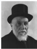
יעקב משה טולדנו שר הדתות