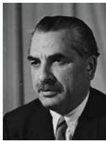
חיים משה שפירא שר הפנים