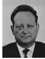
יגאל אלון שר העבודה