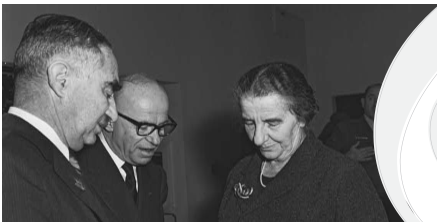
◀ מימין לשמאל: שרת החוץ גולדה מאיר, שר הדואר אליהו ששון ושר המשפטים דב יוסף