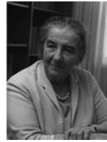
גולדה מאיר שרת החוץ