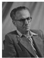
ישראל בר יהודה שר התחבורה