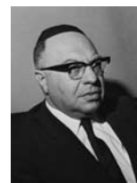
יוסף בורג שר הסעד