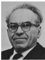
זרח ורהפטיג שר הדתות