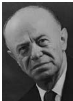
אליהו ששון שר הדואר