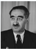
דב יוסף שר המשפטים