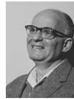
גיורא יוספטל שר הפיתוח והשיכון