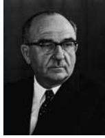
לוי אשכול שר האוצר