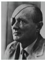
משה דיין שר החקלאות