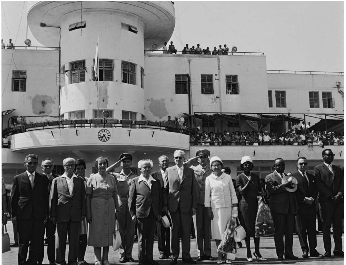
נשיא המדינה יצחק בן צבי (במרכז), מימינו רעייתו רחל ינאית בן צבי, משמאלו ראש הממשלה דוד בן גוריון ושרת החוץ גולדה מאיר, בשדה התעופה לוד