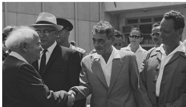
ראש הממשלה דוד בן גוריון לוחץ את ידו של יושב ראש הכנסת קדיש לוז