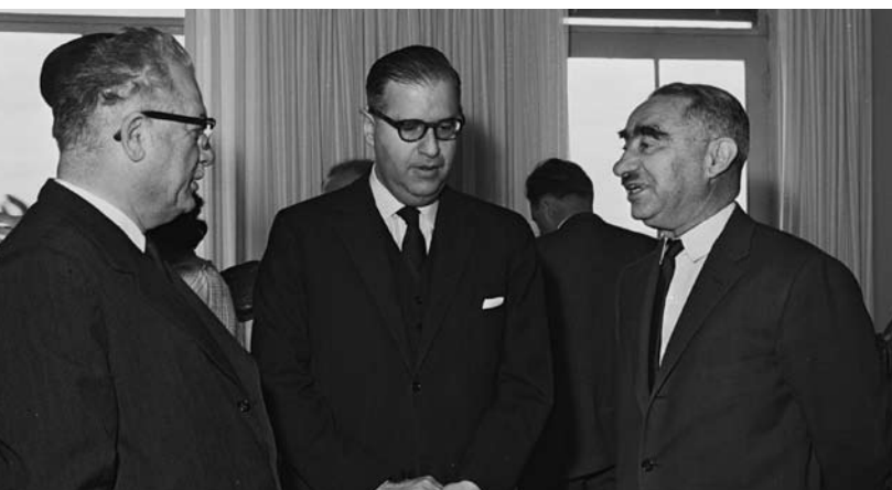
מימין לשמאל: שר המשפטים דב יוסף, שר החינוך והתרבות אבא אבן, ושר הפנים והבריאות חיים משה שפירא