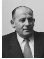
יוסף אלמוגי שר בלי תיק שר השיכון והפיתוח